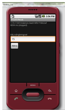
Figur 3.1. Fungerande android-implementation i simulatören

Hashcash metoden utformades under slutet av 90-talet, och det är ett av de mest populära Proof-Of-Work implementationerna. Vi har i våra tester implementerat protokollet samt provat att köra det på olika svårighetsgrader på ett antal nyare processorer. Vi har förutom detta även utvecklat en applikation till Googles android operativsystem (detta med hjälp av Gregory Rubins open source projekt, http://www.nettgryppa.com/code/ ) och provat protokollet på två av dagens mest populära telefoner på mobilmarknaden, nämligen HTC Desire och ZTE Blade. För att komplettera studien har vi även använt oss av Adam Back's benchmarks som kan hittas på dennes hemsida ( http://www.hashcash.org/benchmark/ ).