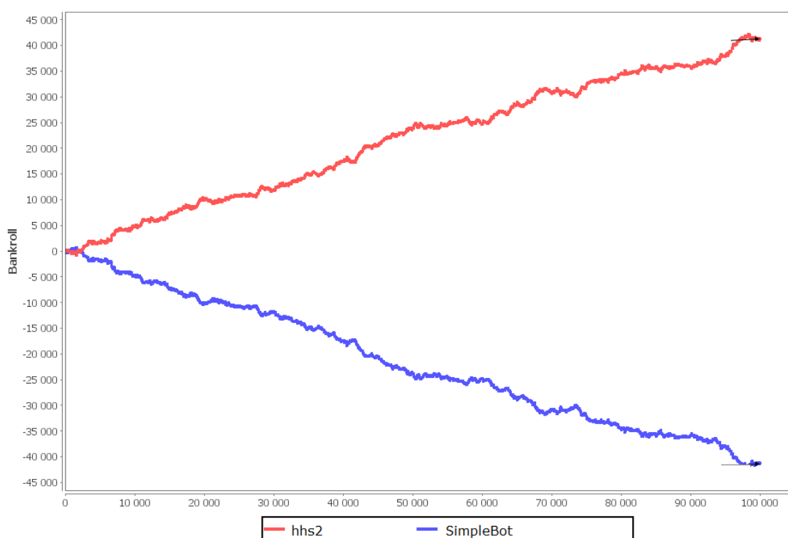
Figure 3: Resultatutveckling över 100000 dubbelsidiga givar. hhs 2 vann med 10.3bb/100.

Följande match simulerades i Open Meerkat Poker Testbed. Open Meerkat Poker Testbed är ett öppet källkodsprogram där pokerbotar som implementerar Meerkat API kan ställas mot varandra. Meerkat API är ett java API (Application Programming Interface) skapat av University of Alberta, som bland annat används av botar i det kommersiella programmet Poker Academy. Med Meerkat API medföljer en enkel bot kallad SimpleBot. Trots sin enkelhet utgör resultatet mot SimpleBot ett bra riktmärke på grund av botens tillgänglighet för alla. När SimpleBot väljer att satsa så satsar den alltid storleken på potten. Det betyder att ingen handlingstolkning behöver göras. Stackstorleken återställdes vid början av varje giv till 100 stora mörkar var.